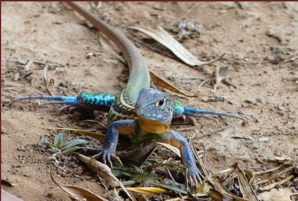
Teius teyou Daudin 1802