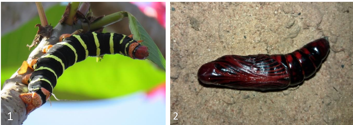
Figs: 1-2: Pseudosphinx tetrio ; 1) larva del ultimo estadio sobre Plumeria sp. Ciudad del Este, Alto Paraná. Fotografía: Nelson Pérez; 2) pupa, colectada como oruga de ultimo estadio en el barrio Recoleta, Asunción.

Aunque no fue posible criar ejemplares desde la puesta, al menos se ha podido registrar un estadio pupal de 22 días para uno de los individuos encontrados en Asunción, coincidente con la duración promedio documentada para la especie en Puerto Rico (Santiago-Blay, 1985).