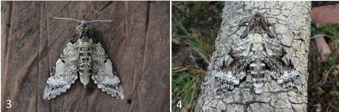
Figs: 3-4: P. tetrio ; 3) hembra adulta, mismo ejemplar que el de la figura 2; 4) macho adulto de Fortin Toledo