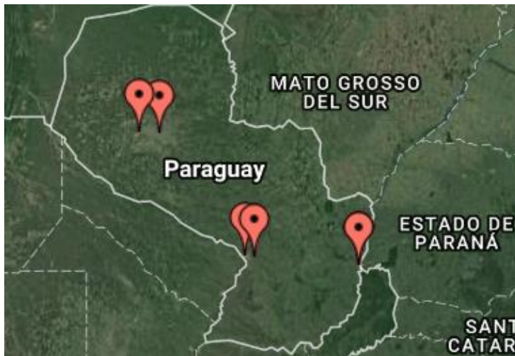
Tabla 1. Registros recientes de P. tetrio en Paraguay, ordenados cronológicamente. Todas las orugas encontradas correspondían al último estadio larval.

Mapa de los registros recientes de P. tetrio en Paraguay. Sitios históricos como Villarrica, Caacupé y Patiño no están marcados, por falta de datos exactos.