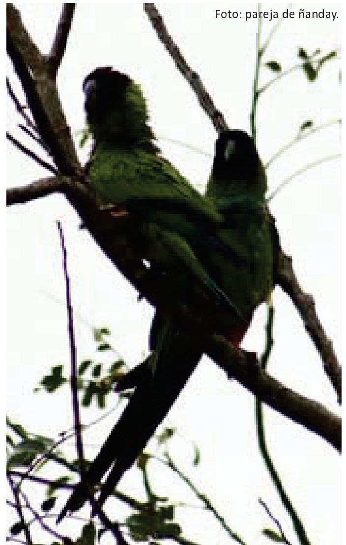
Foto: pareja de ñanday.