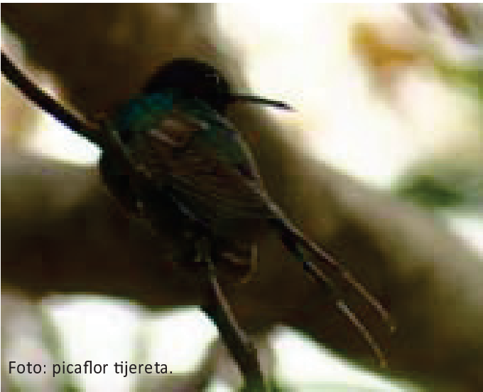
Foto: picaflor tijereta.